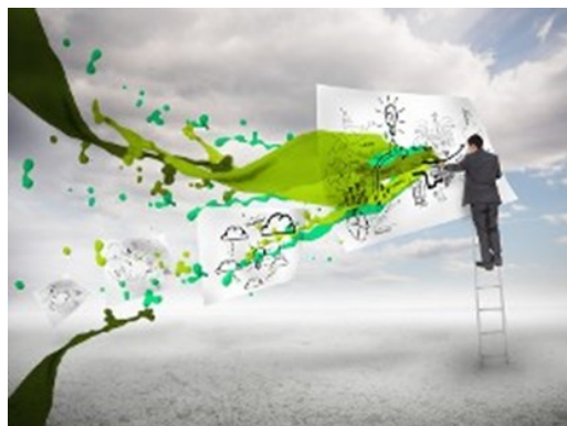
Dispositif INNOV'R® pour promouvoir les éco-innovations

En complément, une approche territoriale est expérimentée au travers d'un appel à projets portant sur l'écologie industrielle et qui a été lancée en coopération avec l'ADEME fin 2013.